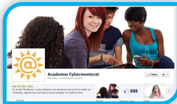
Visuel de notre page Facebook sur Internet.

Lancée il y a à peine quatre mois, notre page Facebook, accueille déjà plus de 870 jeunes du secondaire et des cégeps. Elle a pour objectif de les inciter à visiter le site Internet d'Academos, de bâtir un sentiment d'appartenance autour de notre organisme, ainsi que de leur fournir des informations pertinentes autour de l'orientation et de la persévérance scolaire.